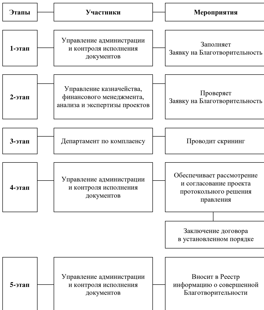
СХЕМА процедуры по Благотворительности